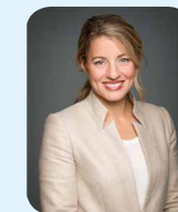
L'HONORABLE MÉLANIE JOLY, ministre du Patrimoine canadien et députée fédérale d'Ahuntsic-Cartierville

« La relance et le développement du secteur Chabanel sont une priorité pour Ahuntsic-Cartierville et je suis fière de collaborer avec la SDC District central dans ce chantier. L'extraordinaire capacité de concertation et de mobilisation de la SDC fait d'elle l'acteur par excellence pour attirer les investissements dans des projets structurants pour dynamiser son territoire. »